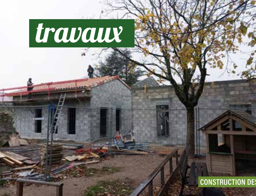
CONSTRUCTION DES NOUVEAUX BÂTIMENTS.