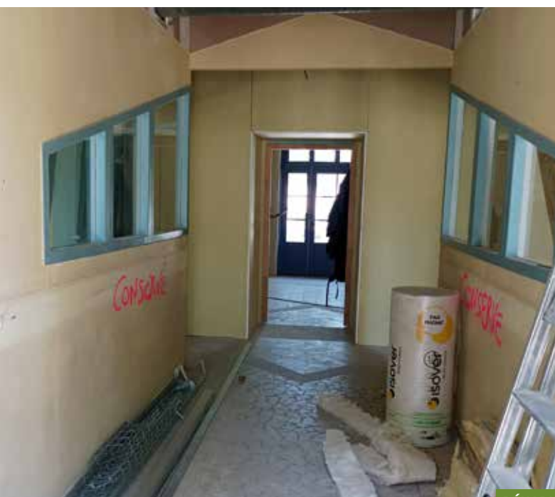
RÉHABILITATION DE L'HÔTEL GUMPERTZ.