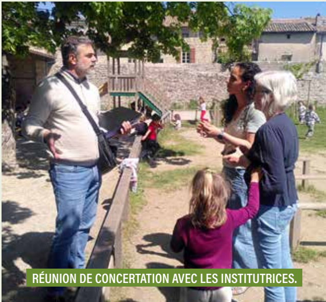
RÉUNION DE CONCERTATION AVEC LES INSTITUTRICES.