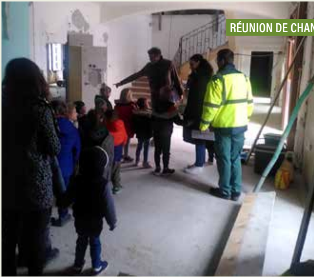
RÉUNION DE CHANTIER AVEC LES ENFANTS.